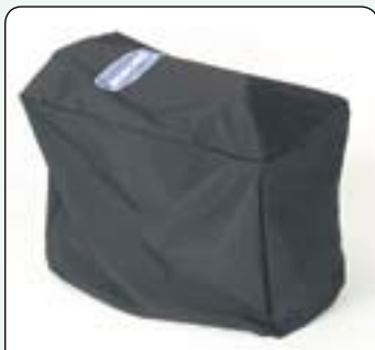
Funda resistente Mantiene el scooter limpio y le protege del polvo.