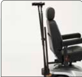
Soporte para bastones y muletas Mantiene el bastón y la muleta siempre estables durante el desplazamiento.