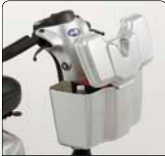
Maletero delantero con cierre Mantiene sus pertenencias en un lugar seguro siempre al alcance de la mano.