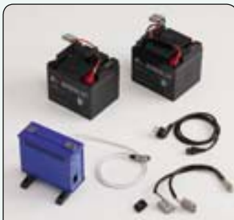
Cargador externo Permite cargar otro juego de baterías mientras está utilizando el scooter.