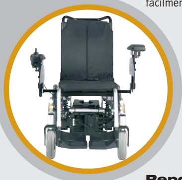
Reposabrazos con regulación lateral y de altura, desmontables para una transferencia lateral sin barreras