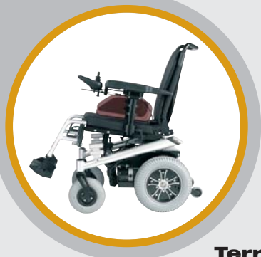
Terra con iluminación apta para exteriores