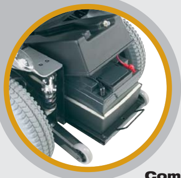
Compartimento de batería fácilmente extraíble